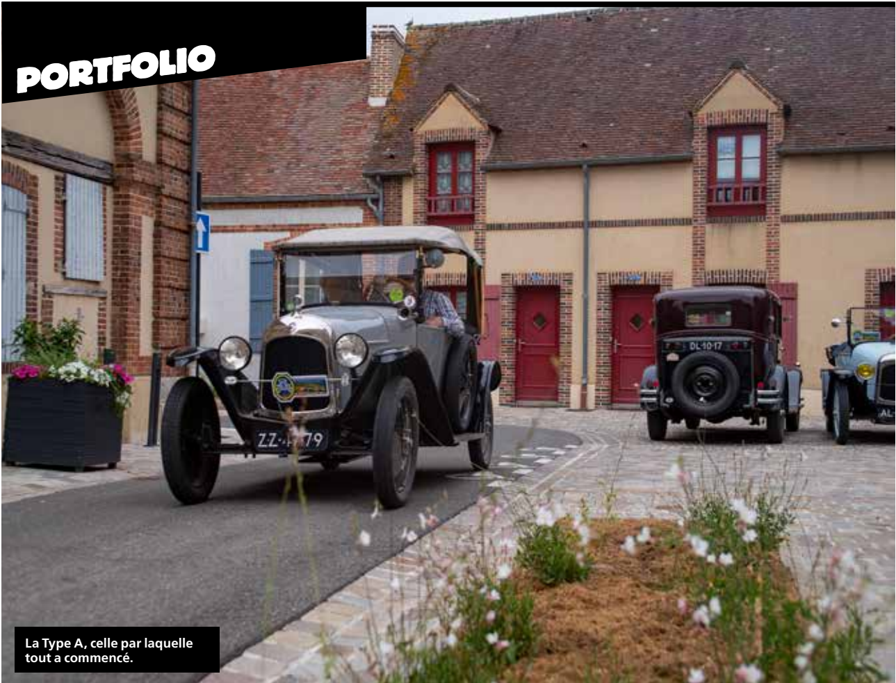
La Type A, celle par laquelle tout a commencé.