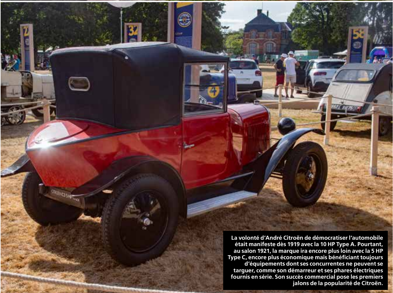
La volonté d'André Citroën de démocratiser l'automobile était manifeste dès 1919 avec la 10 HP Type A. Pourtant, au salon 1921, la marque ira encore plus loin avec la 5 HP Type C, encore plus économique mais bénéficiant toujours d'équipements dont ses concurrentes ne peuvent se targuer, comme son démarreur et ses phares électriques fournis en série. Son succès commercial pose les premiers jalons de la popularité de Citroën.