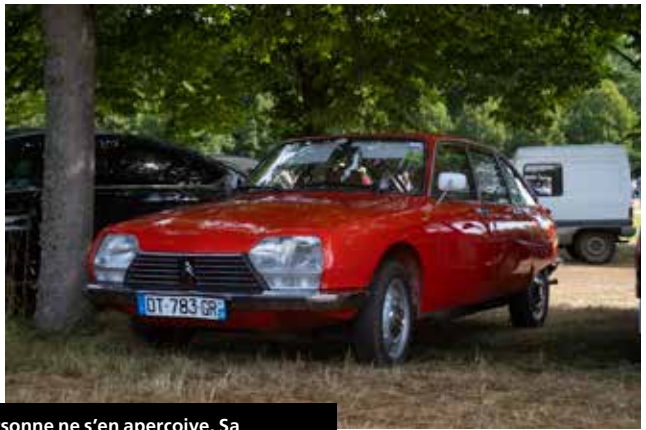
Succès commercial en son temps, la GS a disparu des routes sans que personne ne s'en aperçoive. Sa relative rareté a tardé à éveiller l'intérêt des collectionneurs mais elle semble aujourd'hui sortie d'un long purgatoire... une voiture qui mérite largement d'être redécouverte !