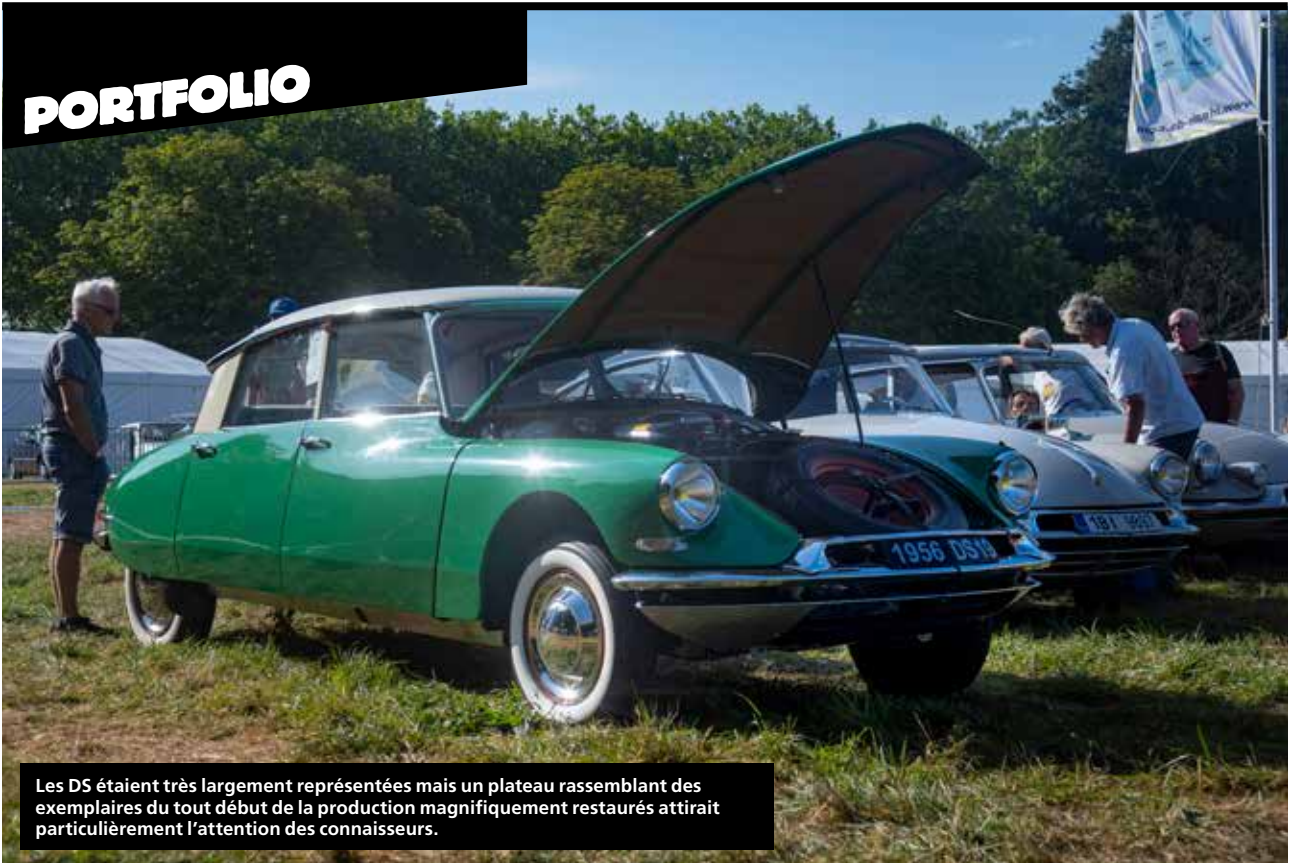
Les DS étaient très largement représentées mais un plateau rassemblant des exemplaires du tout début de la production magnifiquement restaurés attirait particulièrement l'attention des connaisseurs.