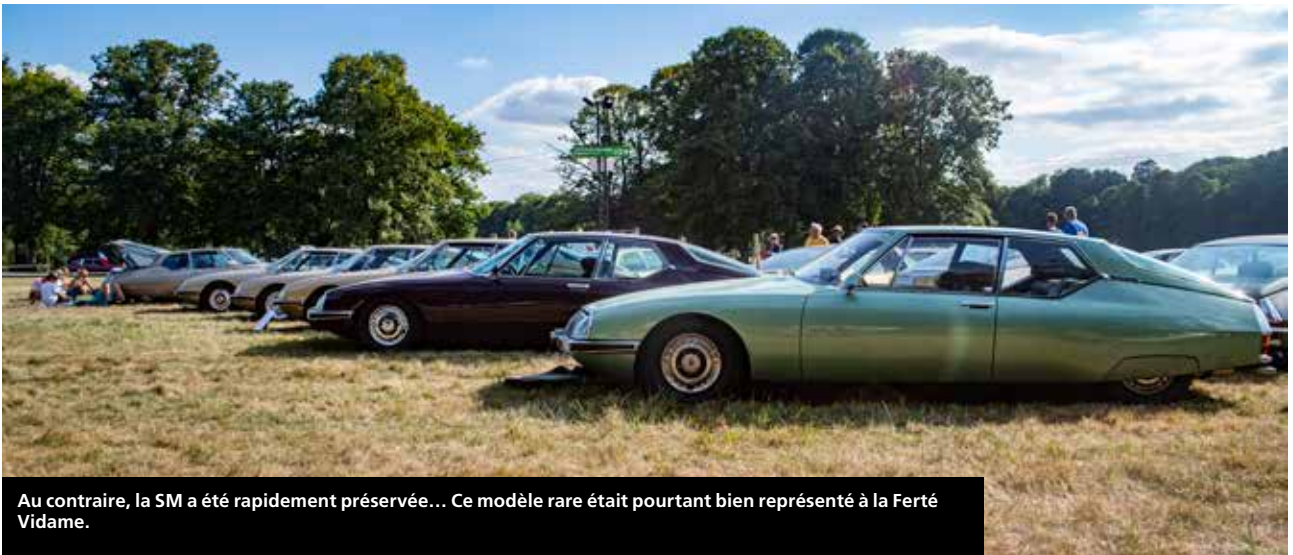
Au contraire, la SM a été rapidement préservée... Ce modèle rare était pourtant bien représenté à la Ferté Vidame.