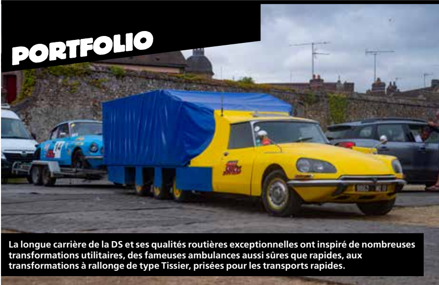
La longue carrière de la DS et ses qualités routières exceptionnelles ont inspiré de nombreuses transformations utilitaires, des fameuses ambulances aussi sûres que rapides, aux transformations à rallonge de type Tissier, prisées pour les transports rapides.